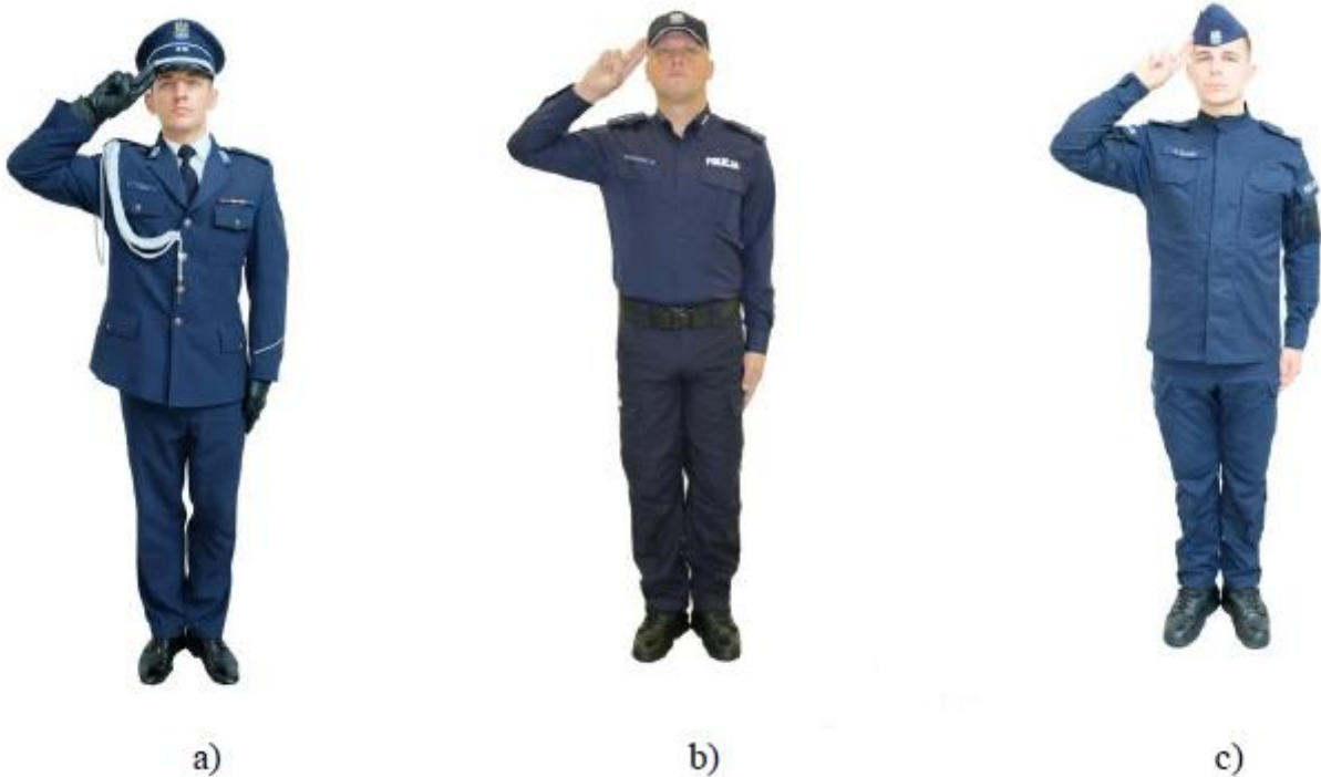
Fot. 1. Policjant salutujący w miejscu bez broni: