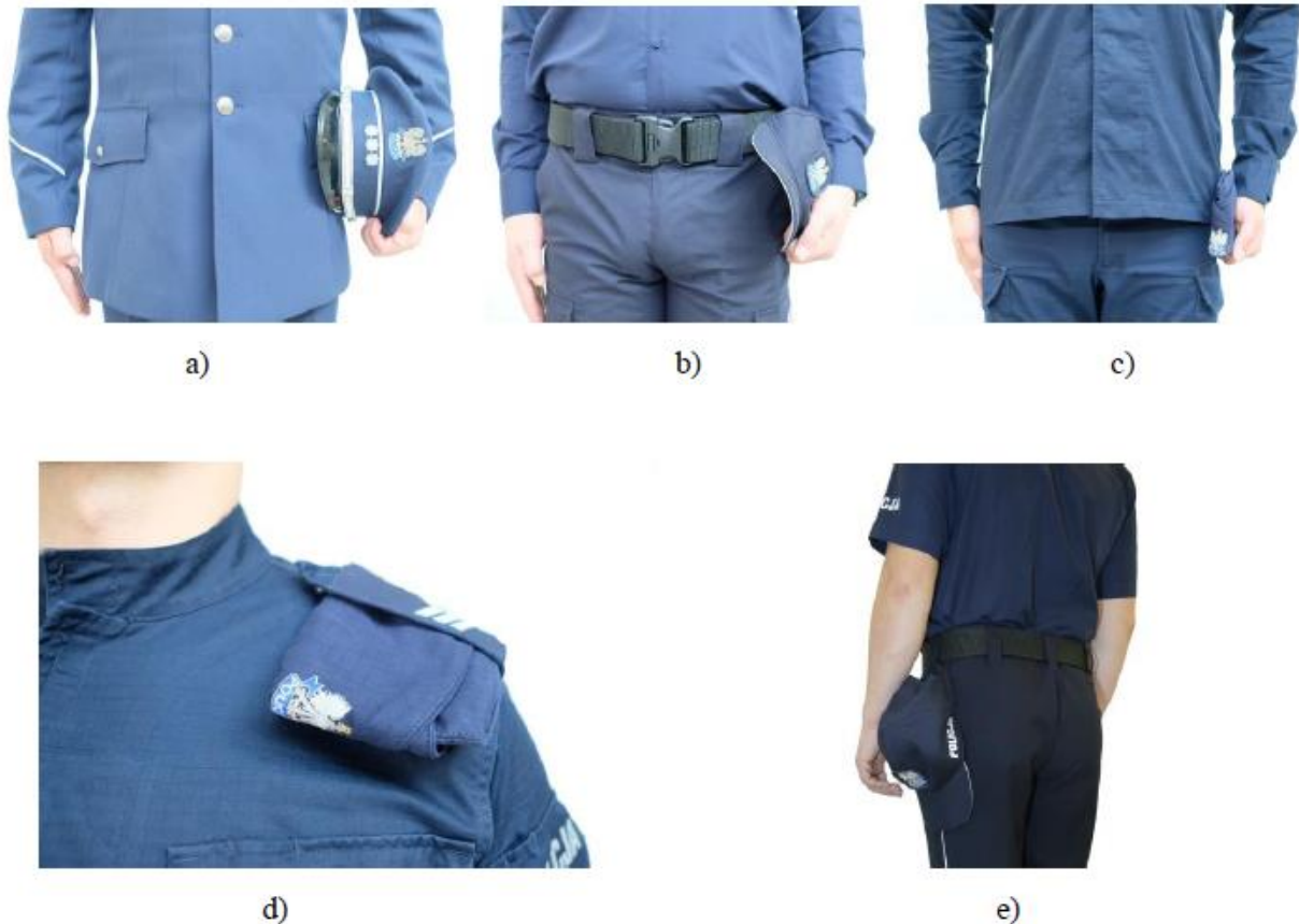
Fot. 15. Sposób trzymania i przenoszenia zdjętego nakrycia głowy, umundurowania: